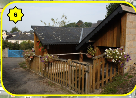
6 Le Lavoir municipal