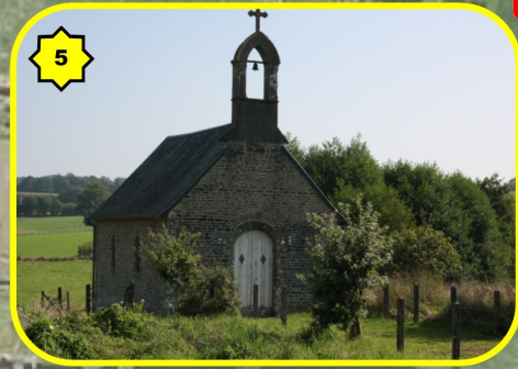
5 Chapelle de Courbefosse 2,5 Km (route de Savigny)