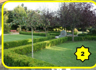
2 Le jardin de curé et sa charmille