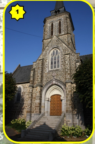
1 L'église de l'Immaculée conception