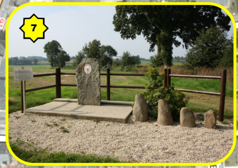
7 Le site de Panama 3,8 Km (route de Désertines)