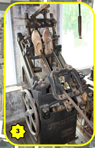
L'atelier du sabot