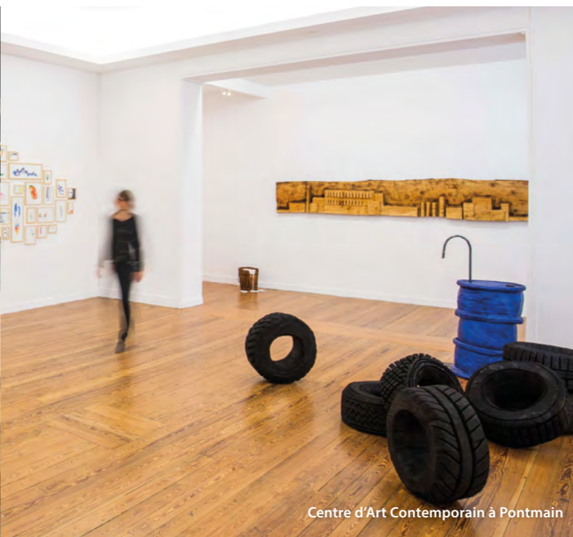
Centre d'Art Contemporain à Pontmain