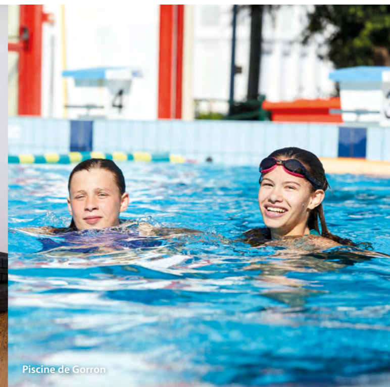
Piscine de Gorron