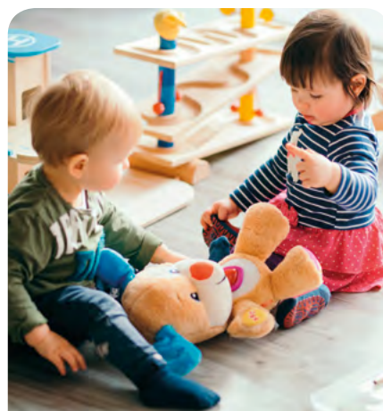
TERRE DE VIE