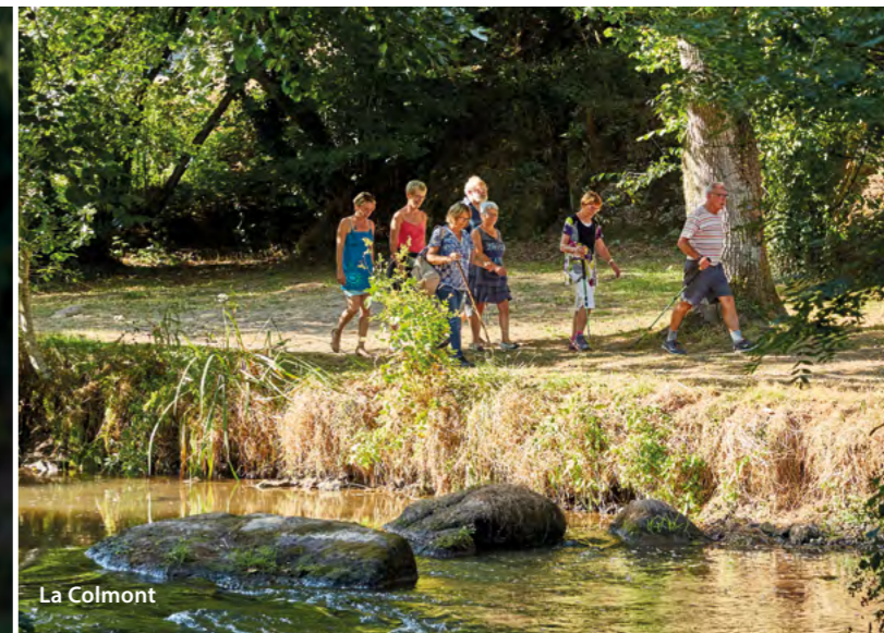
La Colmont La Colmont