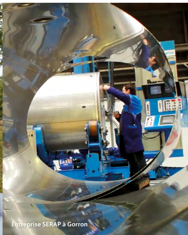
Entreprise SERAP à Gorron